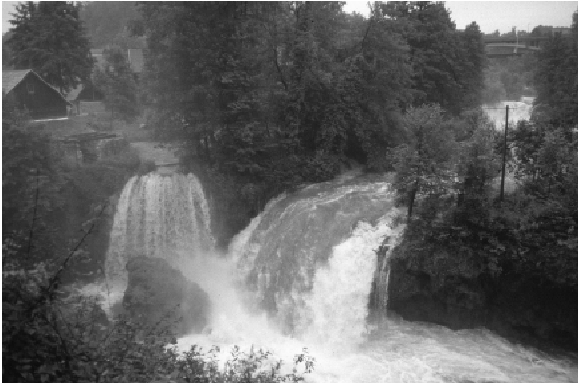
Abb. 1: Die Mündung der Slunjčica in die Korana.

WINTER, A. J. DE (1989): Arion lusitanicus MABILLE in Nederland (Gastropoda, Pulmonata, Arionidae).- Basteria 53:49-51, Leiden.