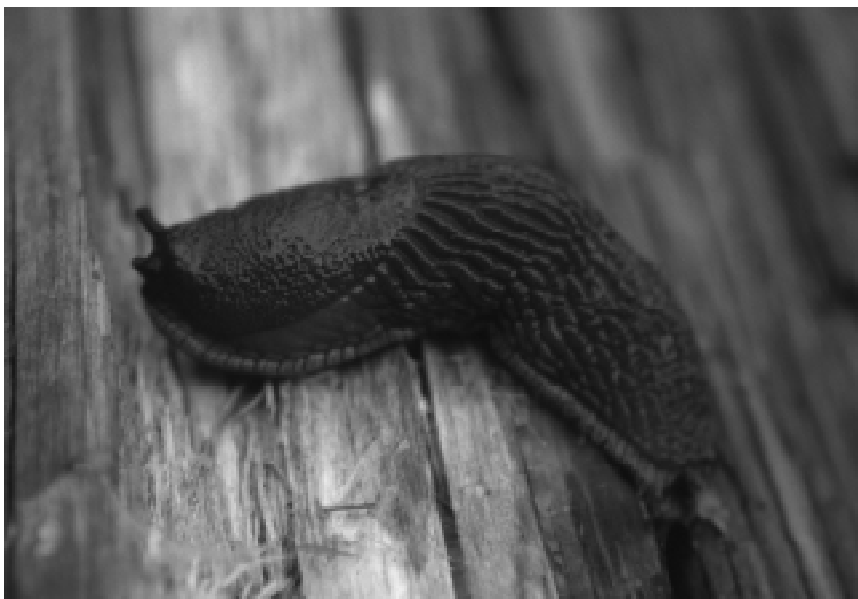
Abb.2: Arion vulgaris MOQUIN-TANDON 1855.