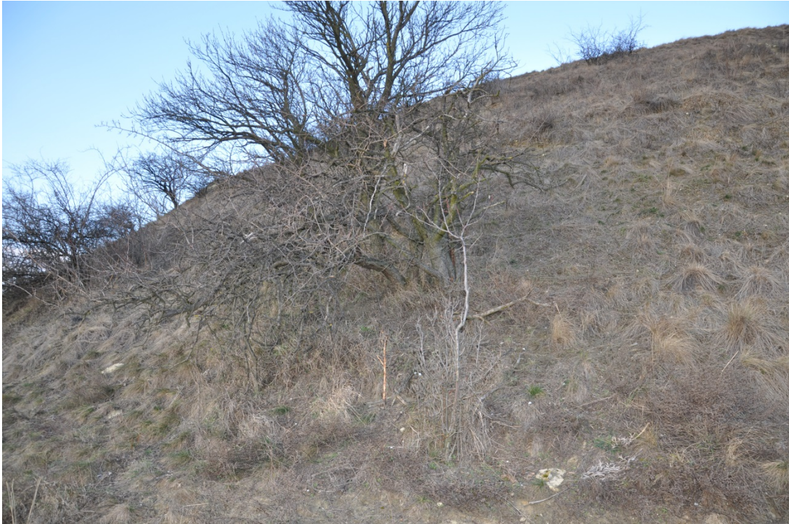
Abb. 3: Trockenrasen, Frauenhaarberg, Kronberg, NÖ.