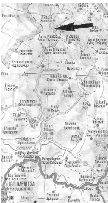
Abb. 2: Lage des Fundortes